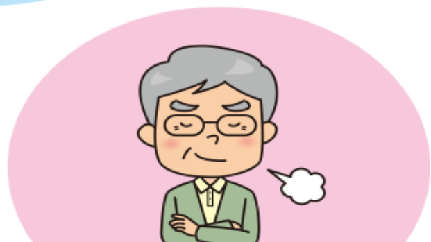
過去の経験に頼りがちになり、形だけの安全確認になりがちになる