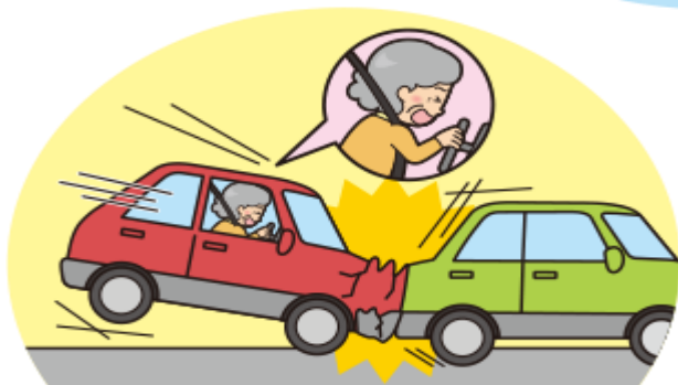
とっさの行動やブレーキ操作などに遅れが生じる