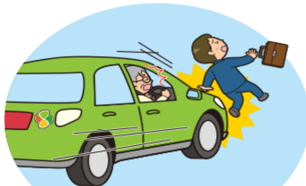
漫然と運転し、信号機や歩行者等を見落としてしまう