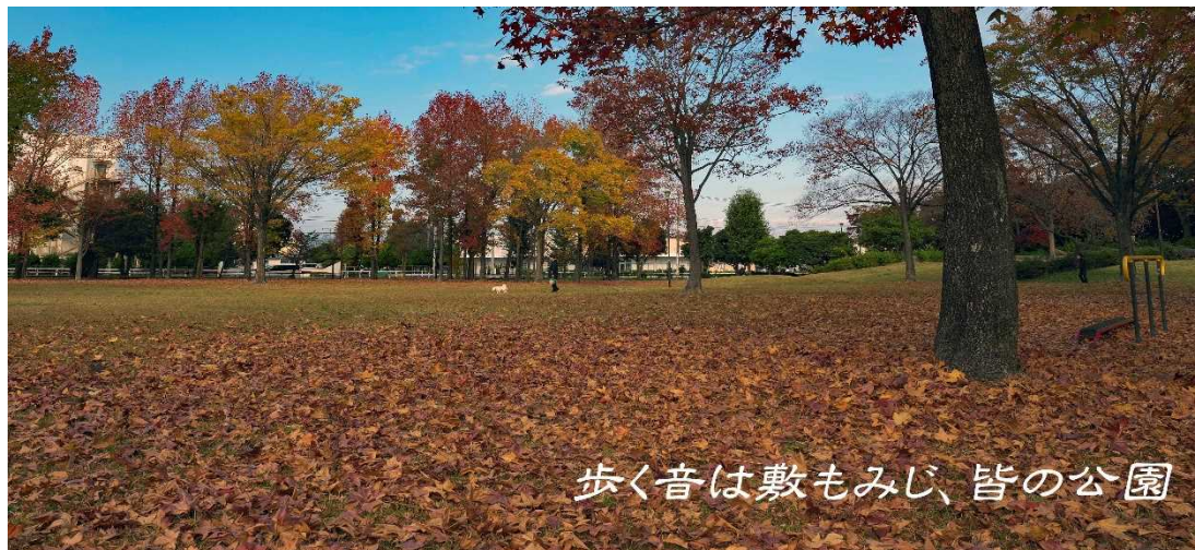
歩く音は敷もみじ、皆の公園