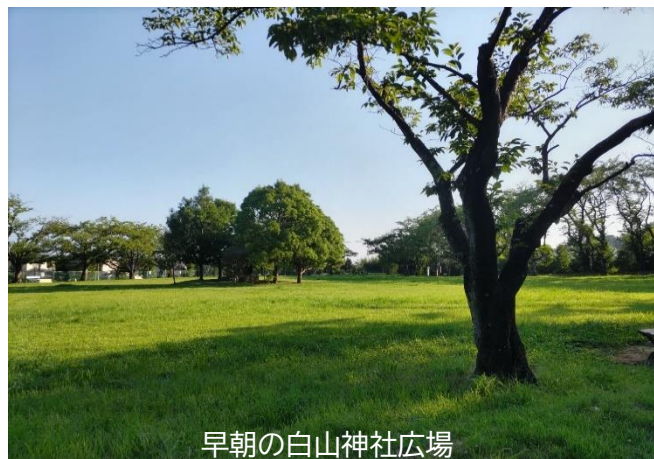
早朝の白山神社広場