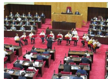
八王子市議会 議場コンサート