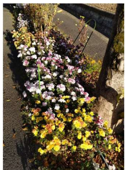
遊歩道 No.1-01 北野台1丁目