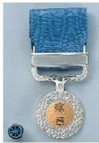
内閣府 HP より

皇居「春秋の間」では、天皇陛下への拝謁があり、記念すべき一日を過ごされたとのことでした。