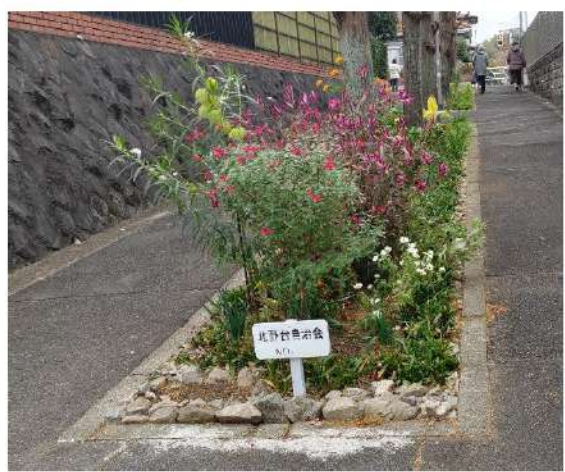
遊歩道 No.2 自治会館近く

訃報 (十二月 六日届出現在) 岡村喜久様 (三丁目) 阿方 稔様 (三丁目) 謹んでご冥福をお祈りいたします