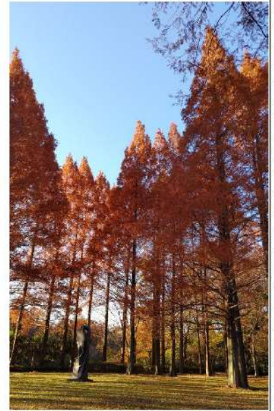
わかば公園 メタセコイアの紅葉

ある地域で数年前、空き巣が多発し、その防犯対策として、 センサーライト (人や動物を検知して自動的に一定期間点灯するライト)を設置したところ、短期間で被害が減少したとの事例がありました。防犯対策の一つとして、何か一つ取り組んでみませんか！ —来年が会員の皆様にとって 健康で最良の年になりますように—