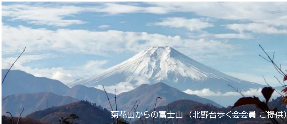
菊花山からの富士山