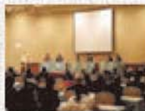
リサイクルフォーラムの開催