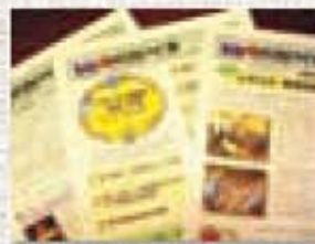
広報誌「We♥りさいくる」