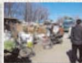
海外リサイクル事情視察会