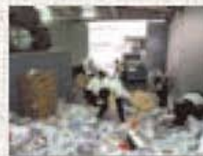
職場体験学習の受け入れ